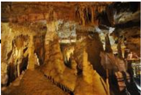
Grotte de Tourtoirac